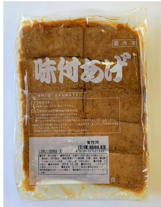
業務用味付いなりあげ