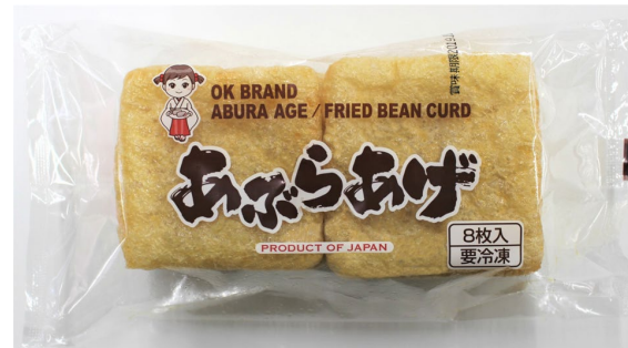
すしあげリテールパック