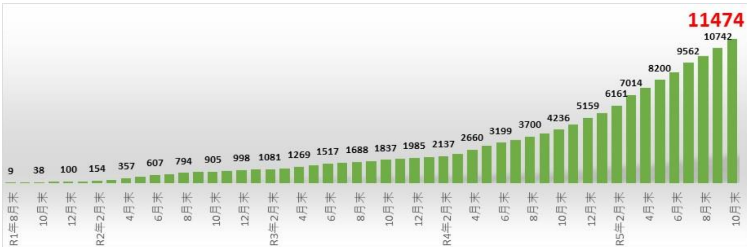
内訳（国別・ルート別）

令和5年10月末現在、11,474人。技能実習からの移行者は323名（約3%）。