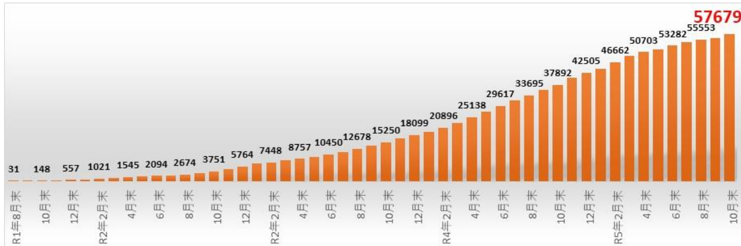
内訳（国別・ルート別）

令和5年10月末現在、57,679人（12分野中最多）。技能実習からの移行者は39,789名（約70%）。