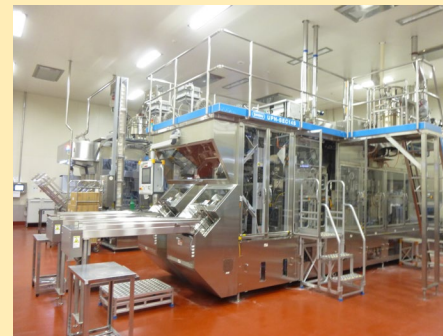
↑導入した1ℓ牛乳パックの充填機

成果： 工程の大部分が機械化 されたことで、 生産性が向上し、省力化 を実現。設備導入時に機械の配置を工夫したことも相まって、 人の出入りが少なく効率的な動線 となり、衛生管理の高度化にも寄与。これらの結果、売上高・経常利益ともに 計画を上回る 実績につながっている。