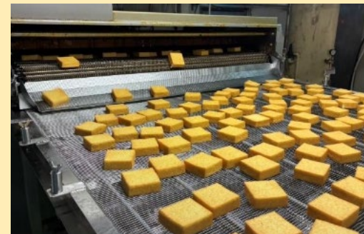
↑ 導入した絹厚揚げ製造ライン

成果：1 製造ラインで 1日当たり60,000個 の厚揚げを製造できるようになった。また、従来、厚揚げは輸入大豆を用いたものが大半で、国産大豆を使用したものは市場にほぼなかったが、 国産原材料使用という付加価値を付け展開 することで、販売も順調に増え、同社の主力となる製品となった。