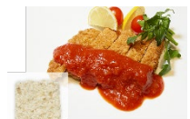
こんにゃくとおからから作られたカツ