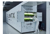
密閉型構造の植物工場