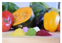
アップサイクル食品