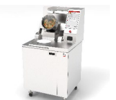
炒め調理ロボット