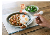
塩味を増強するスプーン

事業戦略検討、試作品製造、マーケティングリサーチ、商品デザイン、テストマーケティング、販路確保、原材料確保