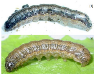
網目模様 淡色部は逆Y字状