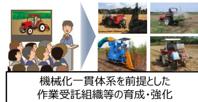
機械化一貫体系を前提とした作業受託組織等の育成・強化