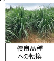
優良品種への転換