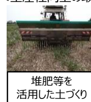
堆肥等を活用した土づくり