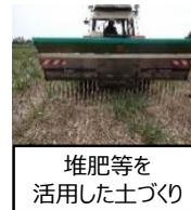
堆肥等を活用した土づくり