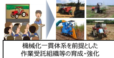
機械化一貫体系を前提とした作業受託組織等の育成・強化