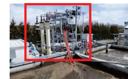
外付け型膜分離装置