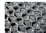
ハニカム（蜂の巣）フィルター