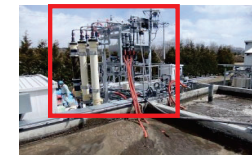
外付け型膜分離装置