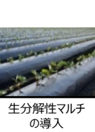
生分解性マルチの導入