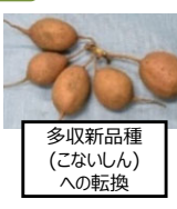
多収新品種(こないしん)への転換

・ でん粉原料用かんしょの生産性向上のための多収新品種への転換、廃プラ排出抑制のための生分解性マルチの導入、省力化に資する農業機械の導入等を支援。