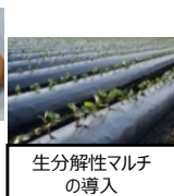
生分解性マルチの導入