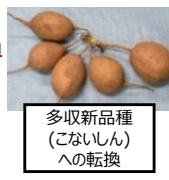
多収新品種（こないしん）への転換

・ でん粉原料用かんしょの生産性向上のための多収新品種への転換、廃プラ排出抑制のための生分解性マルチの導入、省力化に資する農業機械の導入等を支援。