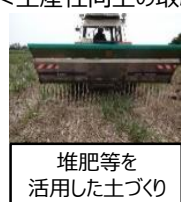
堆肥等を活用した土づくり