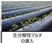
生分解性マルチの導入