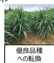
優良品種への転換