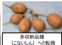
多収新品種（こないしん）への転換