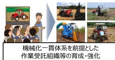
機械化一貫体系を前提とした作業受託組織等の育成・強化