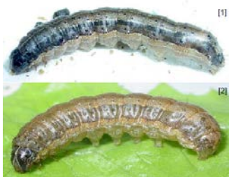
網目模様 淡色部は逆Y字状