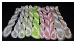
〔ドラム式萎凋機〕 〔蛍光シルクによる新需要の創出〕