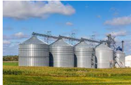
【海外の穀物大型貯蔵施設】

サプライチェーンの効率化・安定化に向けた 出荷・輸出入管理システムの構築に向けた調査