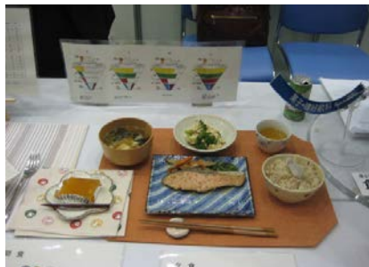
食事バランスガイドを参考にした料理展示