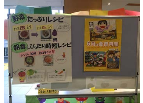
(三重県伊勢庁舎ロビーでの展示の様子)