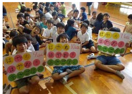
(スペシャルクイズの様子)

今回の集会は、保健委員会とのコラボという形で企画・実施しましたが、それぞれの観点から自分の健康や食生活について、楽しみながら考えることができました。