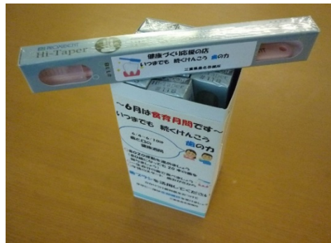
(健康づくり応援の店にて啓発物品の配布)