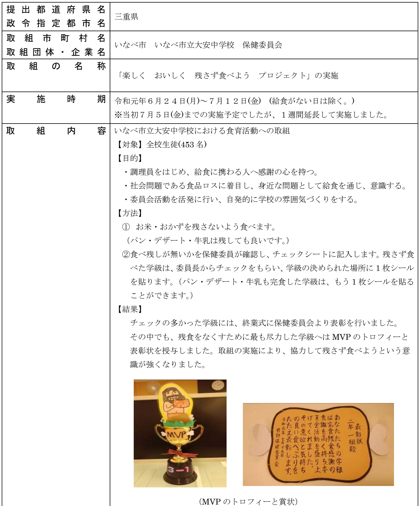
(MVP のトロフィーと賞状)