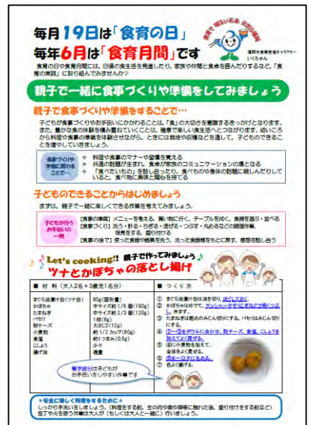
▲本市ホームページで発信した食育月間リーフレット