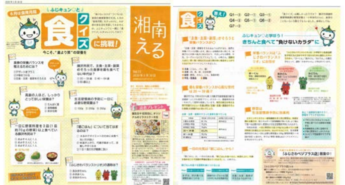
地域生活情報誌「湘南える」記事