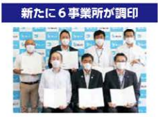
新たに6事業所が調印