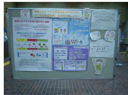
3・1・2 弁当作品展の様子