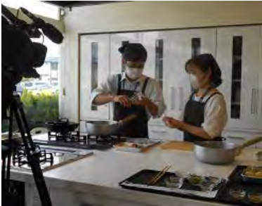
【富士市地産地消弁当】

調理実習や講座に代わる取組として、クッキング動画を撮影し、食育月間のPRを兼ねて「ふじ広報室」よりケーブルテレビ、YouTubeにて配信しました。また、富士市公式インスタグラム「ふじぐらむ」にて漫画形式で紹介しました。