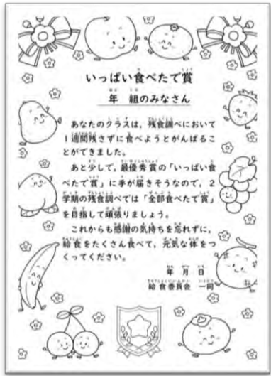
おしくも完食賞にならなかった賞