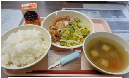
= 1学期のお楽しみ献立 =