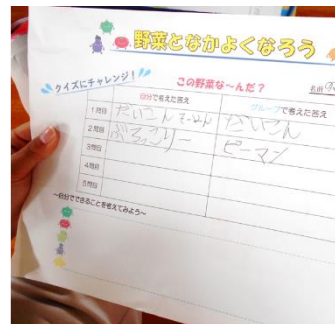
市内小学校3年生学級活動の様子