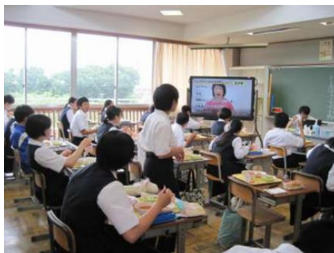
市内中学校で動画を見ている様子