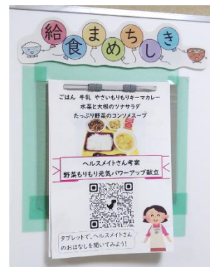
市内小学校の掲示物