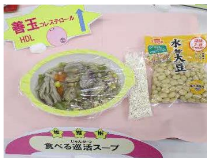
【食べる巡活スープ】