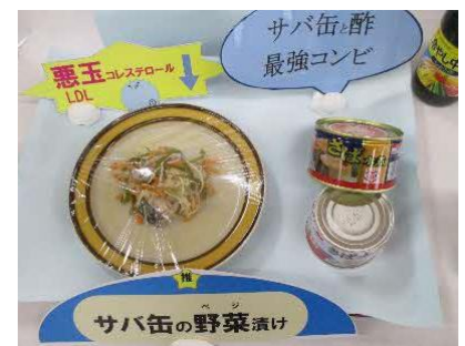
【サバ缶の野菜漬け】