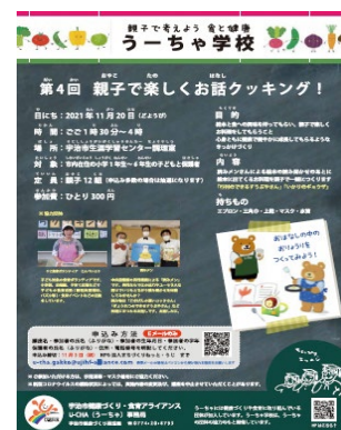
（第4回うーちゃ学校チラシ）