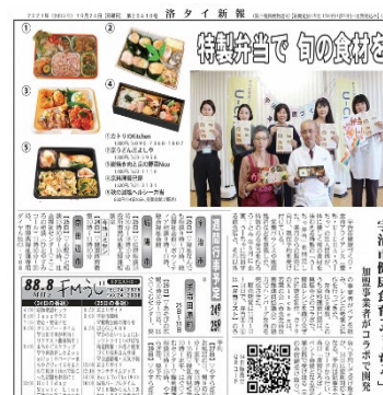
（うーちゃ弁当（10/24 洛タイ新報））