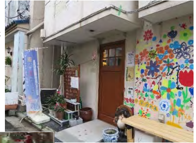
みんなの居場所 “だんだん”

子供が一人で安心して外食ができる場として「子供食堂」を始めました。大人も子供もみんなと一緒に食べることにより、心がなごみ、つながりが生まれ、思いやりの心、食への感謝の心にもつながっています。