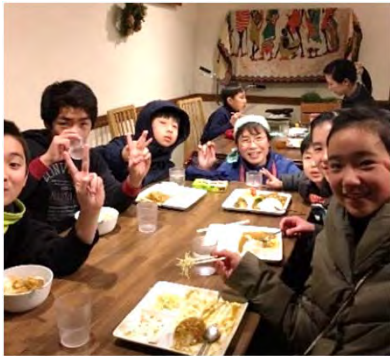
みんなで囲む食卓は笑顔がいっぱい

八百屋を営みながら、学習サポートを始め、大人の学び直しなどを展開。その中で、共食の場として子供食堂をスタートさせました。食が中心になる事で、0歳児から高齢者までが集い自然に異世代交流も生まれ、孤立を防ぐためのセーフティネット、居場所としての機能も併せ持つ場所として、地域の情報収集と発信も行っています。