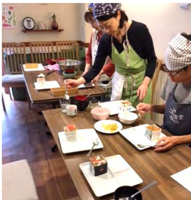
郷土料理教室の様子

毎月1回「郷土料理教室」を開催し、食文化の伝承を学ぶきっかけをつくり、子供たちが料理を作る達成感を味わえ、技術を習得できる貴重な場となっています。また、保護者の要望を受け、近所の小学校の「サマースクール」で、子供だけで参加できる料理教室を、スタッフとともに開催しています。