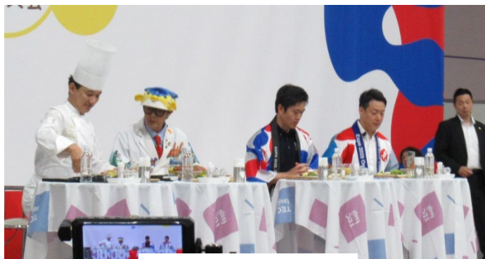
朝食クッキングショー