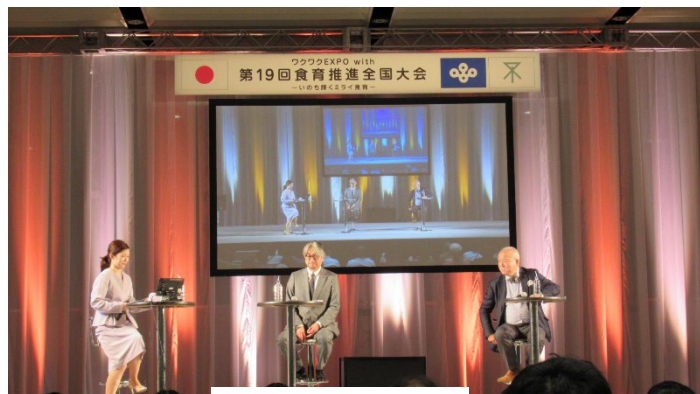
トークセッション