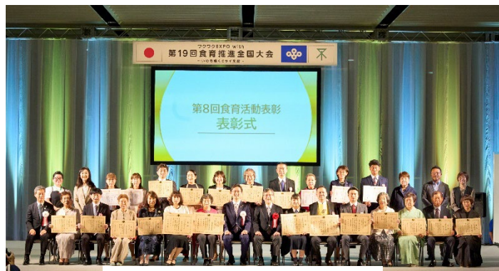
第8回食育活動表彰 表彰式