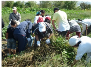
さつまいもの収穫