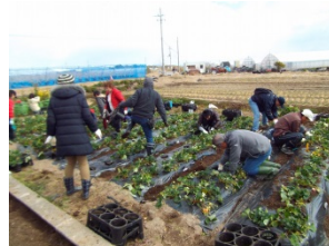
イチゴ苗の植え替え