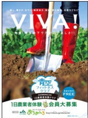
参加者募集チラシ

一般消費者、小・中学生等を対象に、野菜を育て、収穫する喜びを感じてもらい、青空の下で汗を流す楽しさを味わっていただきたいと考え、JAおうみ富士ファーマーズ・マーケット「おうみんち」周辺を会場に「青空フィットネスクラブ」として、年6回実施した。会員の募集にあたっては、近隣市への新聞折込や募集チラシにより行った。