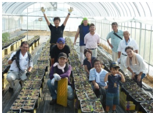
イチゴのハウス栽培