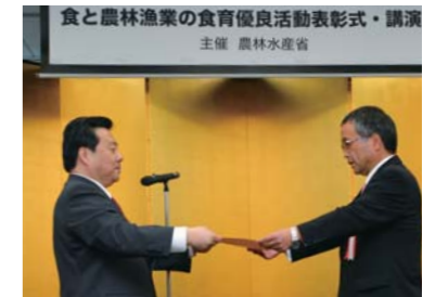
農林水産大臣賞を受賞した 「いばらきコープ生活協同組合」