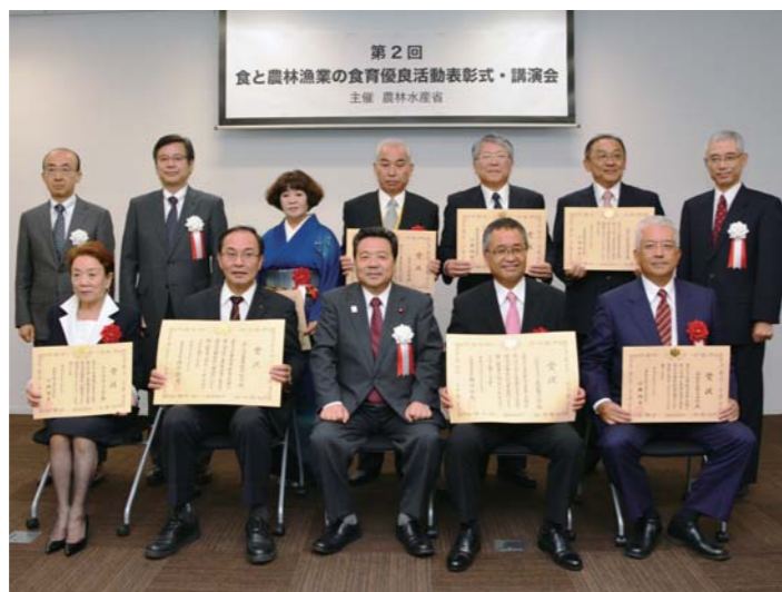
「第2回 食と農林漁業の食育優良活動表彰」受賞者の方々