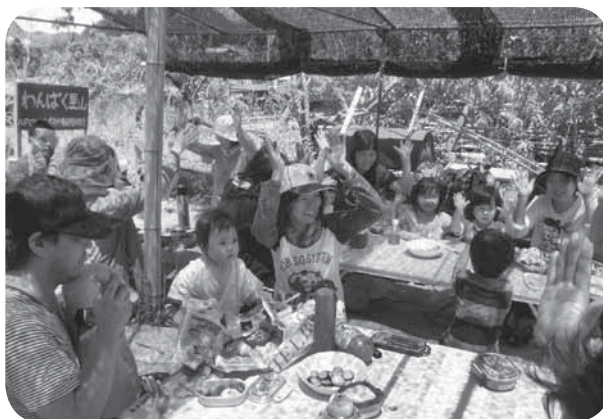
参加者同士のふれあいも生まれる