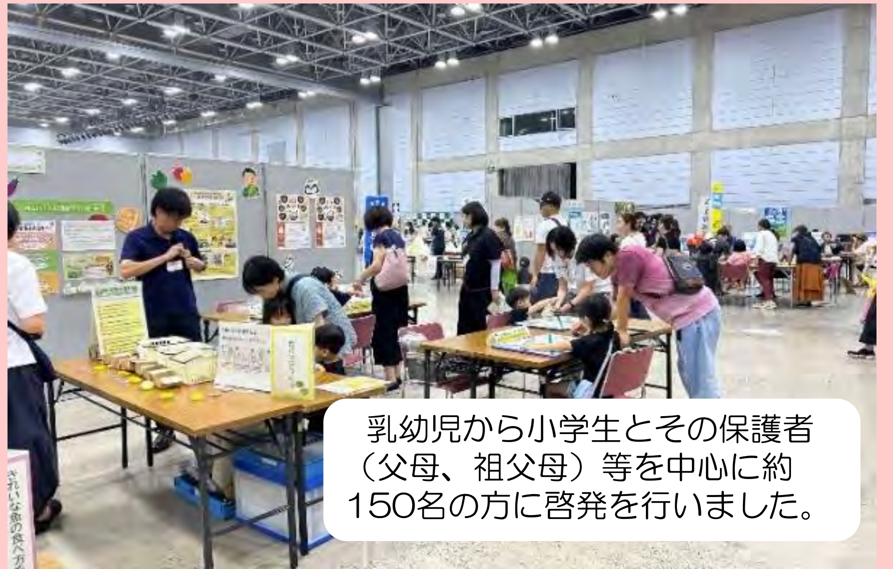
乳幼児から小学生とその保護者（父母、祖父母）等を中心に約150名の方に啓発を行いました。