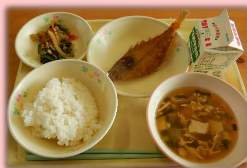
県産品を使用した学校給食

県は、「有機農産物」「美味しまね認証製品」※の活用を推進しており、生産者と学校給食関係者とのマッチング、生産者と生徒との交流、県職員による出前講座の開催及び各種メディアでの紹介により、県産品に対する理解が深まるよう取り組んでいます。