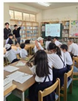
大学生による出前授業

大学生が小学生に対して探究学習等の支援を行い、食品ロスの問題をテーマに学習や活動を企画・実践する「食品ロス削減の輪を広げよう!学校連携事業」を実施しています。