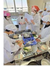
調理実習「苦手克服メニューを考えて作ろう!」