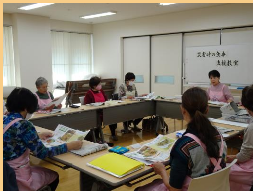
▲ 食生活改善推進員による 災害時の食事支援教室

近年頻度を増している大規模災害に備え、家庭においては、水、熱源、主食・主菜・副菜となる食料品等を最低でも3日分、できれば1週間程度備蓄する取組みを推進します。また、ローリングストック法による日常品の食料品の備蓄を行い、各家庭に合った備えをするよう関係団体等と連携しながら情報発信や普及啓発を行います。