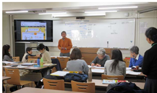
「食育実習Ⅰ」 (世代別食育ロールプレイ) 受講者の発表風景