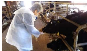
「作業体験(酪農)」給餌