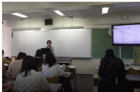
「食育士入門」(専門職へのモチベーション)講義風景

令和元年度は、「食育士」養成講座を14回開催し、学生社会人26名が受講した。講座のテーマは、「食育士入門」「食の循環と環境」、「食の文化」、「食物の衛生・安全・加工」、「食と調理」、「食育教材作成」、「作業体験(農・酪農)」等となっている。