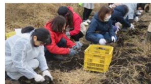
「作業体験(農)」里芋掘り