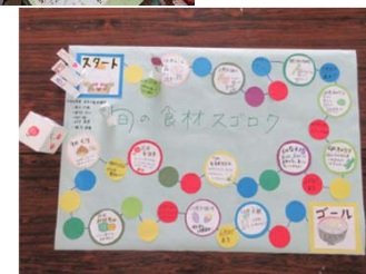
「食育教材作成」 作品:食育すろく