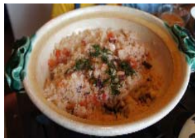
トマトとタコの炊き込みご飯