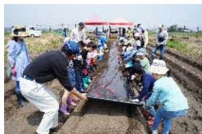
苗植え(マルチの設置)