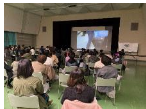
もったいないキッチン上映会