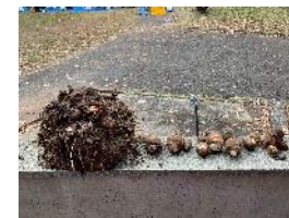
アグリスクールで収穫した里芋