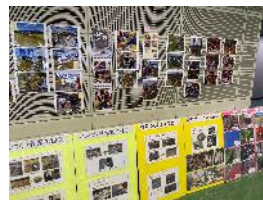
日進アグリスクールの写真展示