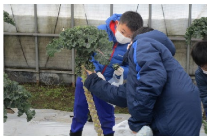
プチヴェール収穫の様子

幼少期から、地場産食材や地産地消への関心を持ってもらうことを目的に、町内の児童・園児を対象に農作業体験を実施した。