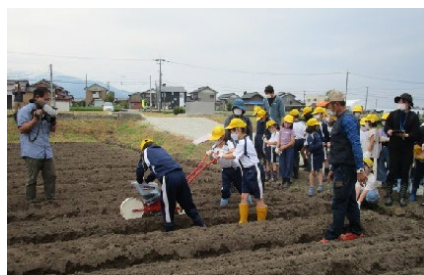
枝豆の植付の様子