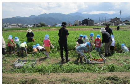
人参の収穫の様子