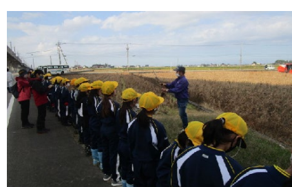
大豆の説明を受けている様子