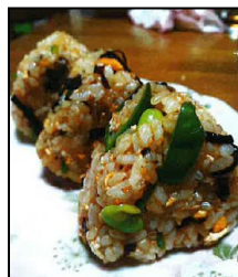
【ピーマン主役の いろどりおにぎり】