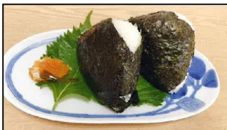
【ブタカナおにぎり】