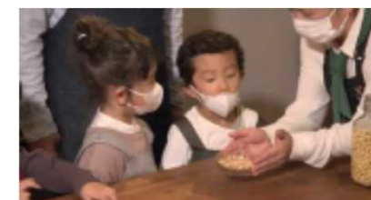
第5回 我が家のオリジナル味噌づくり