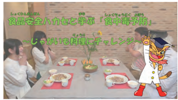
オンライン動画教材 食品安全ハカセと学ぶ「食中毒予防」