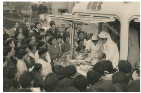
「キッチンカー」(栄養指導車)

「食育」の考え方は明治時代に既に存在していましたが、食育基本法は、改めてその基本理念を定め、法的根拠を付与したとも捉えることができます。