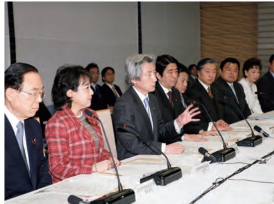
食育推進基本計画が決定された 第2回食育推進会議 (平成18(2006)年3月)