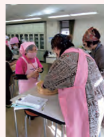
手作り味噌講習会の様子