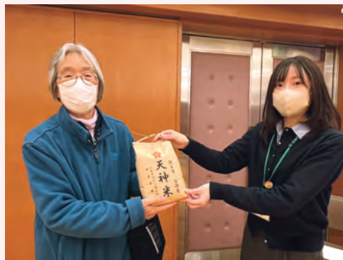
収穫したお米をこども食堂へ寄附する様子