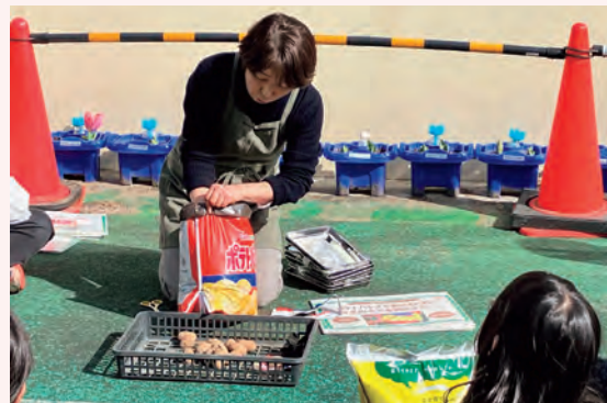
「ポテトバッグ部」の活動の様子