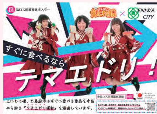
小売店用まえどり運動推進ポスター