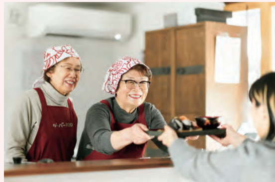
食事の提供の様子