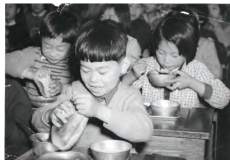
昭和30年代 学校給食の風景