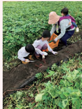
さつまいも収穫の様子