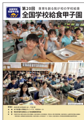
全国学校給食甲子園 ®