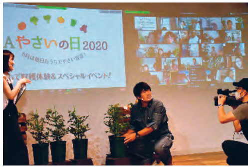
おうちで収穫体験～子供達とつながるリモートイベント～