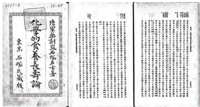
石塚左玄著「化学的食養長寿論」 国立国会図書館デジタルコレクション