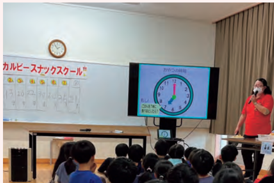
食育出張授業の様子

令和7（2025）年7月には、農林水産省「消費者の部屋」において、ポテトバッグを用いた取組を含めた当社の取組内容を紹介しました。今後も、幅広く様々な対象へ食育の展開を進めていき、将来的にはグローバルに食育活動を拡張していきたいと考えています。