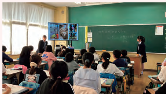
小学校での出前授業の様子