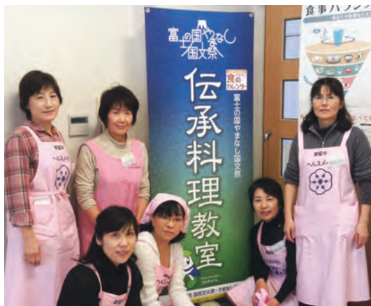
第28回国民文化祭（平成25（2013）年開催） 「やまなし伝承料理教室」

また、平成25（2013）年に、「和食；日本人の伝統的な食文化」がユネスコ無形文化遺産に登録され、日本の食文化や伝統的な食生活についても見つめ直す動きが全国的に見られるようになりました。