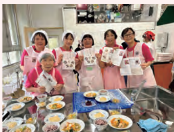
源氏物語レシピ集に掲載する料理