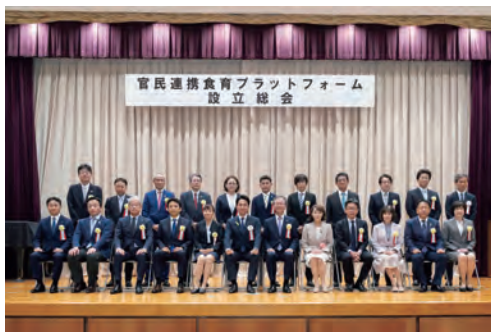
官民連携食育プラットフォーム設立総会