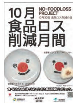
食品ロス削減月間啓発ポスター (令和元(2019)年度版)