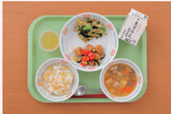
優勝献立 (内藤とうがらしのうまみコーンごはん等)