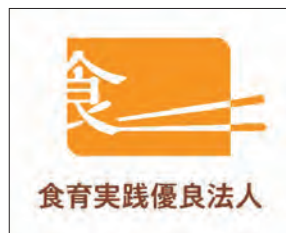
食育実践優良法人のロゴマーク