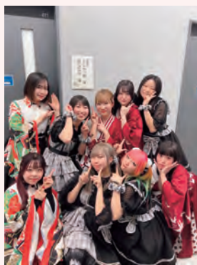
食育アイドル プロジェクトメンバー

これらの取組により、イベント参加者から「いろいろ食べるもの等を考えるようになった。」「教えてもらったことを実践している。」などの声がありました。今後は、企業と連携して北海道外にも進出し、企業とのコラボ商品の販売会や田植・稲刈り等の体験活動を通じて、全国に食育を広めたいと考えています。そして、食育の推進はもちろん、地域を盛り上げることにも貢献していけるよう、楽しく、明るく、元気一杯に活動に取り組んでいきます。