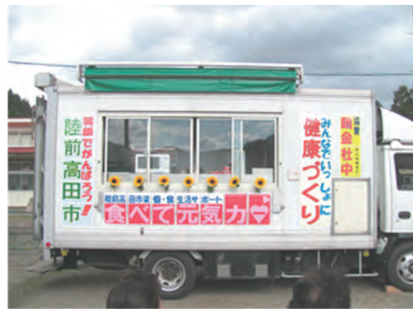
仮設住宅生活者への食生活支援の取組 「食べて元気カー」