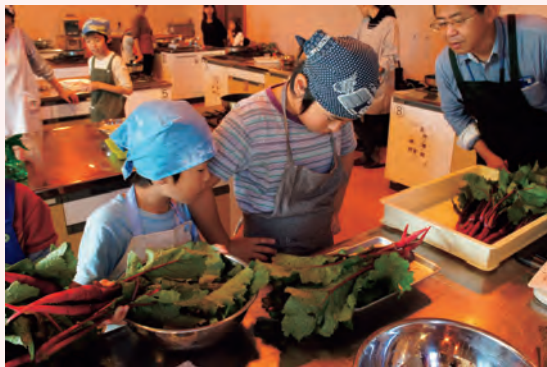
収穫した松阪赤菜を使った漬物作り体験の様子

今後は、松阪ブランドに認定された「きわみいも きわみん ® 」を始めとする地場産物の更なる消費拡大を目指すとともに、より多くの市民が気軽に食と農に触れられる居場所を創出していきます。あわせて、持続可能な地元消費サイクルの確立と、次世代を担う子供たちの豊かな食育の場を提供していきます。