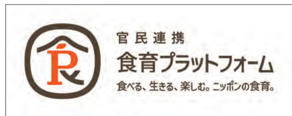
官民連携食育プラットフォームのロゴマーク