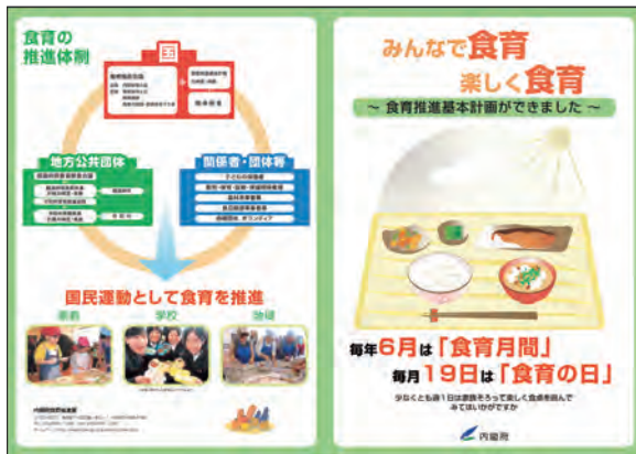
食育推進基本計画リーフレット

し、そのほかにも異常気象による原材料価格の高騰や穀物市場への投機的な資金の流入等、複数の要因が絡み、穀物価格が急騰し、国民の食生活も外食支出が落ち込むなどの影響を受けました。