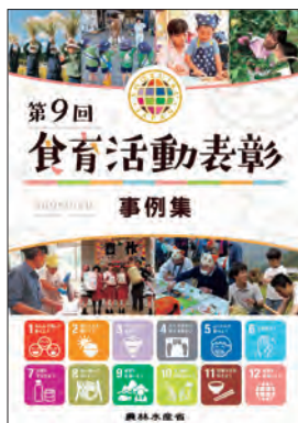
食育活動表彰 事例集

いずれも現場における日々の取組が表彰されることにより、国民の食育への理解が深まることを目指し実施されています。