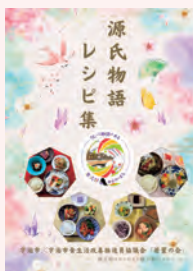
源氏物語レシピ集

今後も、他団体との連携を積極的に行い、健康的な食生活を支援する輪を広げる活動を続けていきます。