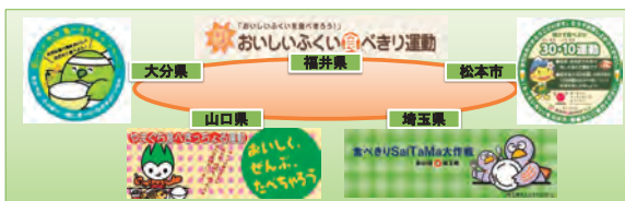
3R推進全国大会「全国食べきりサミット」イメージ図 (平成27(2015)年11月 開催地：福井県)

第3次食育推進基本計画の計画期間においては、令和元(2019)年に、「食品ロスの削減の推進に関する法律」(令和元年法律第19号)が施行され、「食品ロスの削減に関し、国、地方公共団体等の責務等を明らかにするとともに、基本方針の策定その他食品ロスの削減に関する施策の基本となる事項を定めること等により、食品ロスの削減を総合的に推進すること」(同法第1条)を目的に、国民運動としての食品ロス削減に向けた取組が全国で行われるようになりました。