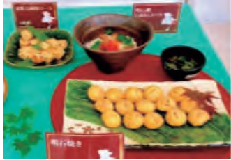
摂津地方郷土料理