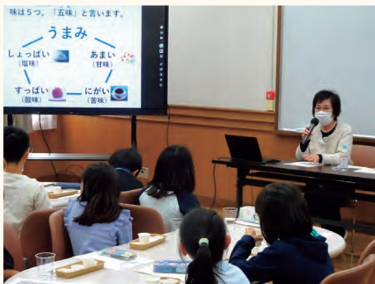
和食文化に関する出前授業の様子

こうした「和食月間」における取組を通じて、和食文化の価値を次世代へとつなぎ、その伝統や魅力が改めて認識されることが期待されます。