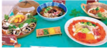
播磨地方郷土料理