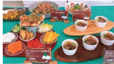
但馬地方郷土料理