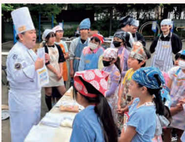
野外炊き出し訓練

北海道地方本部 おびひろ 帯広支部では、令和7（2025）年9月に帯広市立 あいこく 愛国小学校にて食育授業を開催しました。メニュー作りは令和7（2025）年1月から始め、生徒の意見をまとめて、調理で使うピーマン、にんじん、じゃがいも、アスパラガス、かぼちゃ、枝豆、スイカを学校の農園で育て、自ら収穫をしました。シェフと子供たちはグループに分かれて、ピーマンの肉詰めやポトフ等を調理し、合計70名分の料理を作り上げました。今年で9回目となる食育授業は今後も継続する予定です。