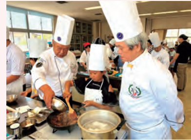
親子料理教室の様子

後進の育成には正しい知識と技術を学ぶ必要があることから、東海地方本部では令和6（2024）年度に引き続き、令和7（2025）年5月には食鳥加工の企業と共同で若鶏のさばき方の講習会、令和7（2025）年6月には水産加工の企業と共同で真鯛 したびらめ と舌平目のおろし方の講習会を開催し、合計10名の一般の方と若手調理人が参加しました。魚のおろし方の実習では、鯛の骨の硬さ、舌平目の骨の柔らかさと身の壊れやすさ等、魚の特徴を踏まえた実技に苦勞しながらも、魚をおろす機会が少ない若手調理人にとって貴重な体験となりました。