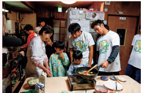
大学生と子供たちとの料理体験の様子