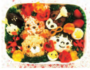
「第15回全国こどものための愛情弁当コンテスト」 農林水産大臣賞：おともだちいっぱい弁当