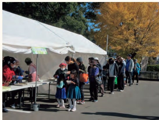
くじらのだご汁を振る舞う様子