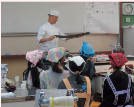
小学校における食育授業の様子

今後は、現在取り組んでいる食育活動を他地域でも展開し、日本全国に向けた活動をしていくとともに、日本料理の世界への普及を目指し幅広く継続的な活動を行っていきたいと考えています。それにより、郷土料理や地域の食文化の再発見、日本料理の魅力の発信につなげていきます。