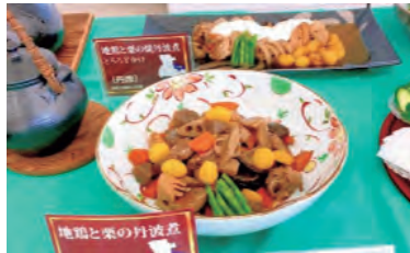
丹波地方郷土料理