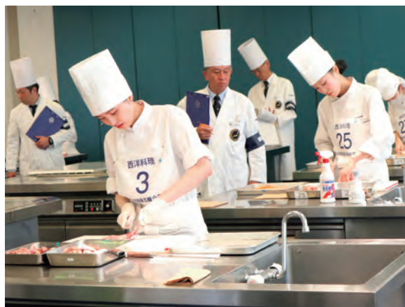
第63回技能五輪全国大会

後進の育成につながる活動として、23歳以下の青年技能者を対象とした技能五輪全国大会では、長年にわたり大会の運営に協力しています。令和7（2025）年に開催された第63回大会においても、競技課題の作成や審査等、その運営全般を担いました。また、世界各地に配属される公邸料理人の育成においては、ウェブサイト等で情報を提供するなど、食文化の継承及び調理技術の向上等に努めています。