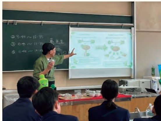
お茶のいれ方教室の様子