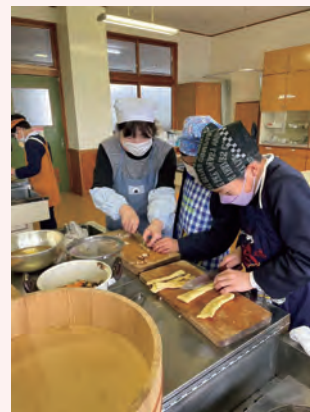
小学校における行事食の伝承活動の様子