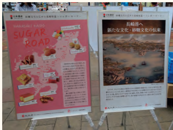
シュガーロードの展示パネル

釜炒り茶、手揉み茶といった伝統的な製茶方法の実演・体験や、食用くじらの歴史を紹介するパネル展示、くじらのだご汁を振る舞うことを通じて、東彼杵町の食文化の歴史と魅力を広く発信しました。