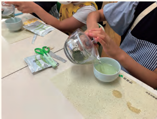
子供たちがお茶をいれている様子

今後も、プロジェクトへの参加者を募りつつ、更なる事例を収集し、お茶の消費拡大に向けた活動を行っている団体等と取組を発信していきます。それにより、一層のお茶の消費拡大につながるよう全国各地に茶育の取組を広げていきたいと考えています。