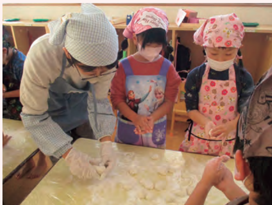
お餅つき会の様子

今後も、市の関係部局の管理栄養士等と協働し、幅広い世代へ食文化を伝承するとともに、地域と連携しながらより一層、食育活動を推進していきます。