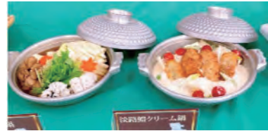
淡路地方郷土料理