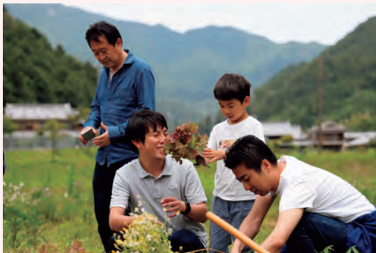
レタスの収穫体験の様子

今後は、行政機関とも連携しながら妊産婦や乳幼児も参加しやすい食育の活動を行うとともに、幼稚園での食育体験を発展させ、エシカル消費につながるよう取組を推進していきます。くわえて、後継者育成のため、地域の高校と連携して活動への想いを伝えていきます。