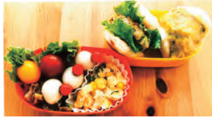
「第15回全国こどものための愛情弁当コンテスト」 最優秀賞：ナン（なん）でも彩玉たっぷり弁当