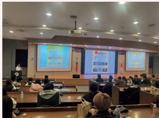
海外の料理関係者・大学生に向けた講演の様子