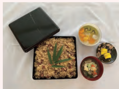
郷土料理「しょうゆおこわ」

講習会では新潟県の郷土料理であるしょうゆおこわを作り、皆で会食しました。しょうゆおこわは、昔、あずきやささが貴重で手に入りにくかったため、しょうゆを使って色付けたのが始まりと言われていることなど、郷土料理の歴史や風習についても説明し、一緒に学びを深めました。参加者からは「しょうゆおこわを作ったことがなかったので、大変参考になった。」等の感想があり、これからも地域住民に郷土料理を伝承していくことの必要性を感じました。