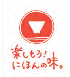
新たな和食普及プロジェクトのロゴマーク

また、子供や子育て世代を対象として「簡単・手軽」に和食を食べてもらうために平成30（2018）年度から官民協働で実施していた「Let's！和ごはんプロジェクト」について、近年のSNS重視の風潮や、健康志向の高まり、持続可能性への関心等を踏まえ、ターゲットやコンセプトを拡大するとともに、若年層への対応強化を図りました。令和7（2025）年11月からは、新たな和食普及プロジェクト「楽しもう！にほんの味。～和のこころをつなぐ食の国民運動～」(略称：楽し味（たのしみ）プロジェクト)として、おいしく、健康で、誰もが楽しむことのできる和食スタイルの実現を目指し、活動を開始しました。