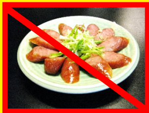
シャンチャン(香腸)