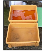
推奨される踏込消毒槽の設置方法