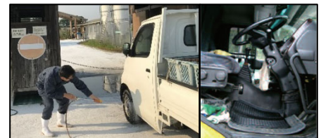
車両はタイヤだけでなく、 泥よけの内側まで消毒 し、 フロアマットの交換やペダル等車内も消毒