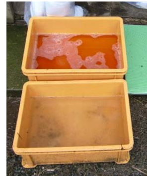
推奨される 踏込消毒槽の設置方法