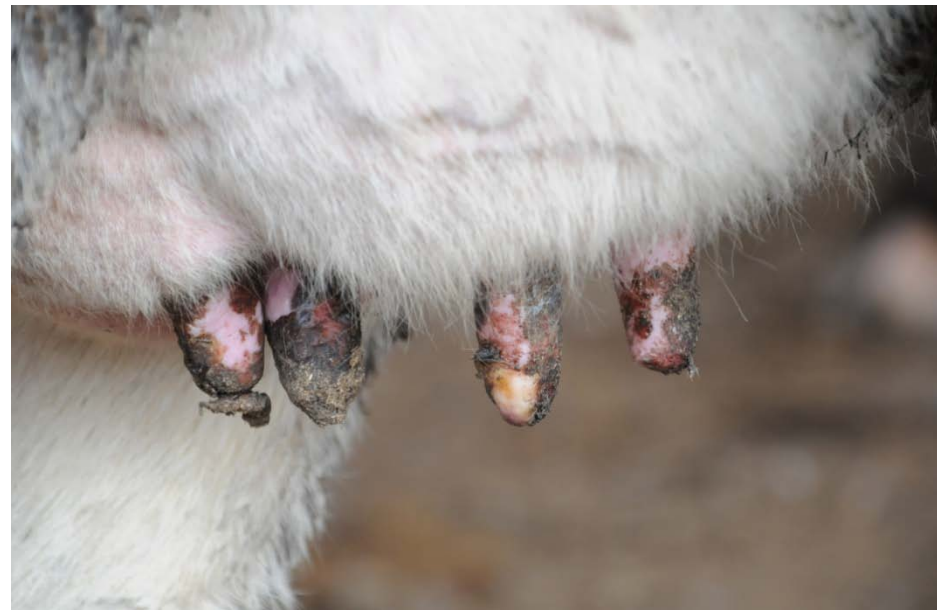
乳頭のびらん、痂皮(ホルスタイン種)