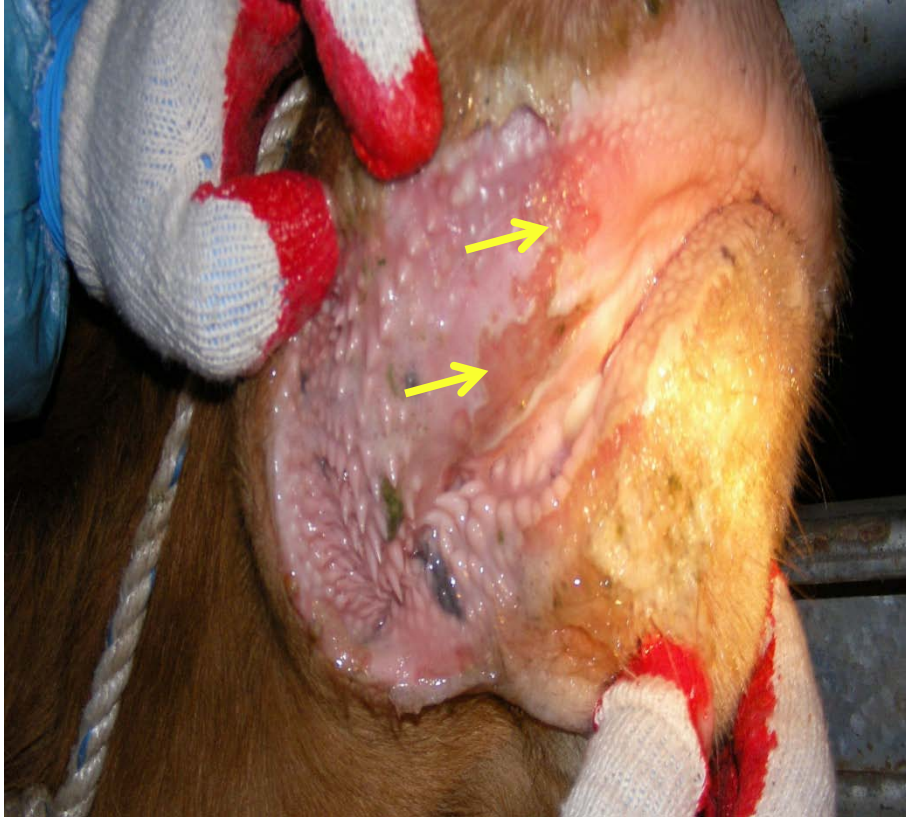
口腔内のびらん(韓牛)