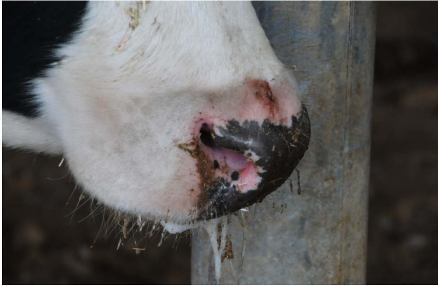
流涎(ホルスタイン種)