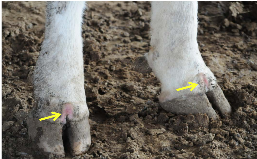
蹄冠部皮膚のびらん(ホルスタイン種)