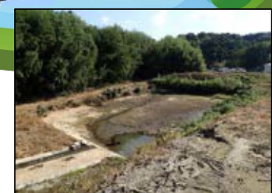
鶏舎周囲の池の 水抜き