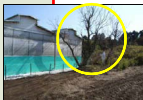
家きん舎周囲の整理・ 整頓(樹木の剪定等)