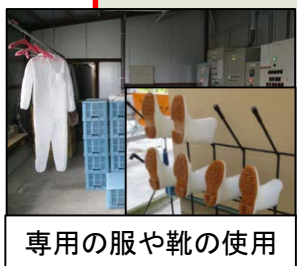
専用の服や靴の使用