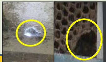
壁や金網の破損修繕