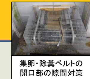
集卵・除糞ベルトの 開口部の隙間対策