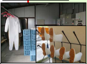
専用の服や靴の使用