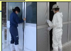
出入りの最小限化