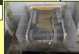
集卵・除糞ベルトの開口部の隙間対策