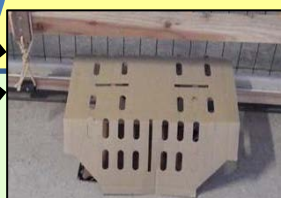
ねずみ対策 (トラップ設置)