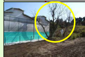
家きん舎周囲の樹木の剪定