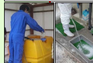
消毒液の定期的交換