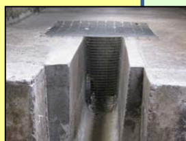
排水溝等からの侵入防止対策 (鉄格子の設置)