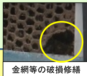
金網等の破損修繕