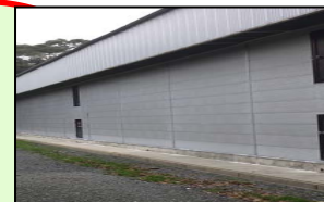
家きん舎周辺の整理・整頓