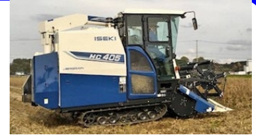
【コンバインによる収穫】