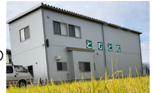
【(合)とむとむ事務所全景】