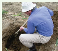
土壌診断に基づく土づくり