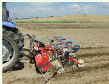
大豆300A技術 （不耕起播種栽培など）